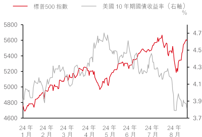
圖 1：股市經過近期拋售後大幅反彈

過去表現並非未來表現的可靠指標。